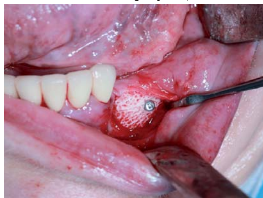
Рис. 3. Пациент Н. - фиксация индивидуального аллогенного костного блока в полости рта у пациента с

использованием титанового мини-винта фирмы «Конмет»