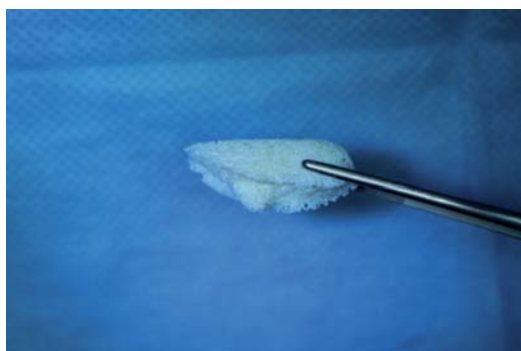
Рис. 2. Лиофилизированный аллогенный костный блок, изготовленный методом фрезерования

В момент оперативного вмешательства хирургу необходимо только провести позиционирование аллогенного им-